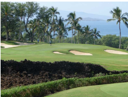
Ein Graben im Fairway,

Es könnte durchaus sein, dass beim einen oder andern Turnier kurzfristige Anpassungen am Platz gemäss nachfolgenden Mustern vorgenommen werden. In Frage kommen: