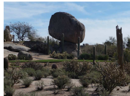
oder ein kleiner Stein als Ersatz der Flagge.