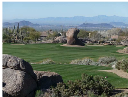
ein Hindernis auf der Bahn,