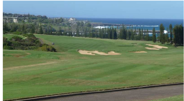
Wärmend ist der Blick vom Clubhaus über das 9. Fairway auf Kapalua Plantation (Maui).

So lautete die Zusammenfassung des Gespräches zwischen Moderator und Wetterexperte heute Morgen, Sonntag, 24. Februar kurz vor 9 Uhr auf Radio SRF1. Wer aus dem Fenster schaute sah, wie sich die blattlosen Äste in der Bise bei Temperaturen unter dem Gefrierpunkt leicht hin und her bewegten. Mein Fazit: Es könnte noch eine ganze Weile dauern, bis wir uns auf dem Golfplatz begegnen. So oder so: Die Vorfreude ist die schönste Freude.