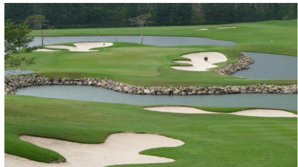
Da gibt's nie Schnee (Hole # 4, Black Mountain Golf Club, Hua Hin).

Das Programm wird heuer durch viele Events in Kiesen und eine tolle Vertretung auf der schweizerischen Bühne reich befrachtet.