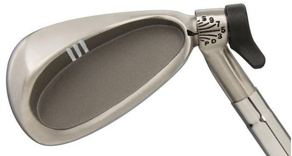
The 33-in-1 Golf Club. Hammacher Schlemmer offers this, a replacement for your entire set of clubs. It has an adjustment that provides 33 different lofts. The company even went to the trouble to offer the 33-in-1 in right-handed and left-handed models, 37 or 38 ½ inches in length to accommodate shorter or taller players. Seriously. Has anyone ever seen one of these clubs in play?