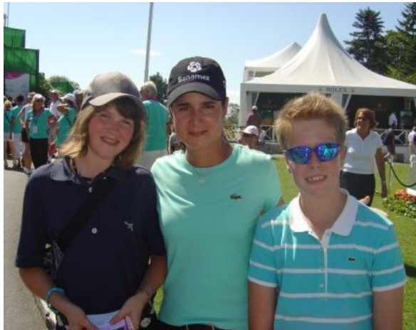
(Sympathische Begegnungen mit Annika Sörenstam und Lorena Ochoa)