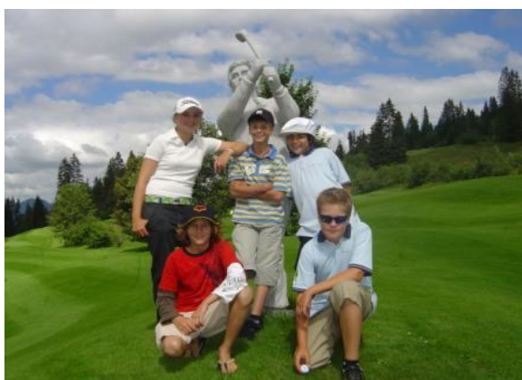
(Qualifikationsturniere in Wylihof und Gstaad)