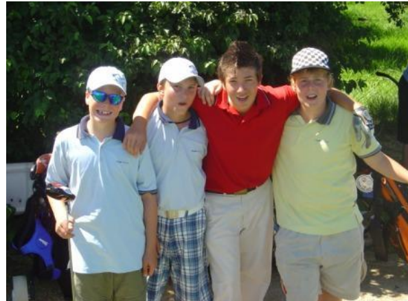
(Gruppenbild in Weissensberg mit Bode Miller) (ausgelassene Stimmung in Bad Bellingen)